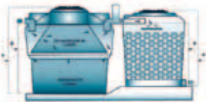
Station de traitement biologique