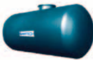
Réservoirs souterrains en PRV