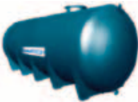
Réservoirs de surface en PRV

La gamme des produits pour ces traitements est la suivante: