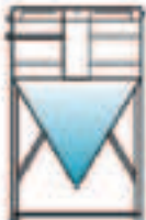
Séparateurs de boues